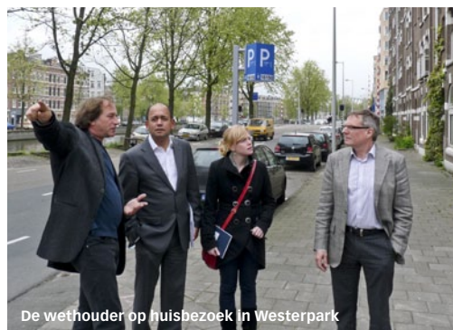
De wethouder op huisbezoek in Westerpark

Het plan van minister Donner om alle huurwoningen in Nederland 25 punten extra te geven is van tafel. Dat bleek tijdens een Algemeen Overleg op 18 mei. Vanuit de hele Kamer kwam kritiek op het voorstel. Huurdersorganisaties protesteerden fel en in Amsterdam kwam in korte tijd een campagne op gang. Via de website www.huurdersbedonnerd.nl stuurden 1600 mensen een reactie naar de betrokken Kamerleden, die zich voor het overgrote deel fel tegen de maatregel keerden. Warm voorstanders waren de Amsterdamse woningcorporaties, die zich zorgen maken over de heffing voor de huurtoeslag die de minister vanaf 2014 wil opleggen. Door alle huurwoningen 25 punten extra te geven kan de huur voor nieuwe huurders stijgen met € 123 per maand. Bovendien kan dan 1 op de 3 huurwoningen bij leegkomst geliberaliseerd verhuurd worden, waardoor de huurder het recht op huurprijzbescherming verliest. Verder zouden de regels voor woonruimteverdeling en splitsing voor veel woningen niet meer gelden. De minister heeft aangekondigd dat hij in juni met een nieuw voorstel wil komen.